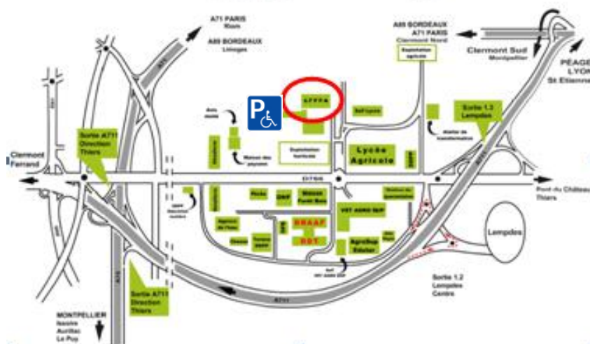
PLAN DU SITE DE MARMILHAT - LEMPDES (63)

Nos locaux sont accessibles aux personnes à mobilité réduite conformément à la réglementation en vigueur